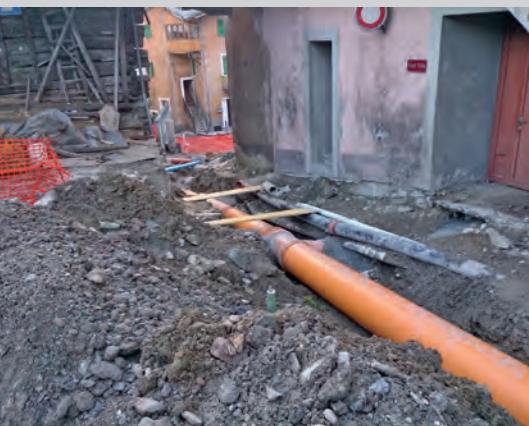
Conduite des eaux usées à Fond Villa

Le service technique communal se tient à votre disposition pour vous conseiller dans ces travaux.