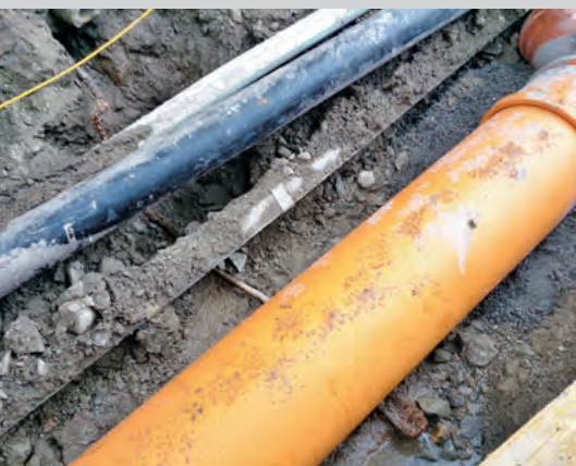
Raccordement des eaux claires

Cette nouvelle infrastructure – bien qu'inachevée – a déjà permis à l'Office du tourisme de donner une ambiance festive et colorée à «l'après ski» de ce début de saison hivernale.