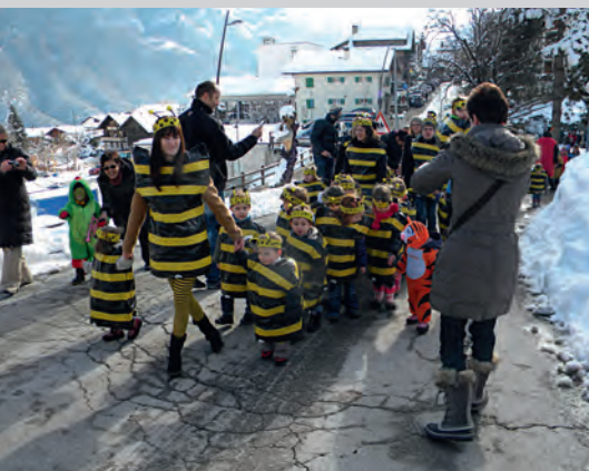
Cortège de carnaval 2013