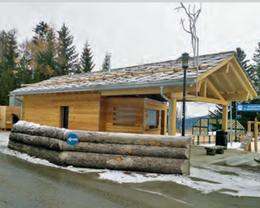
Local d'animation aux Collons