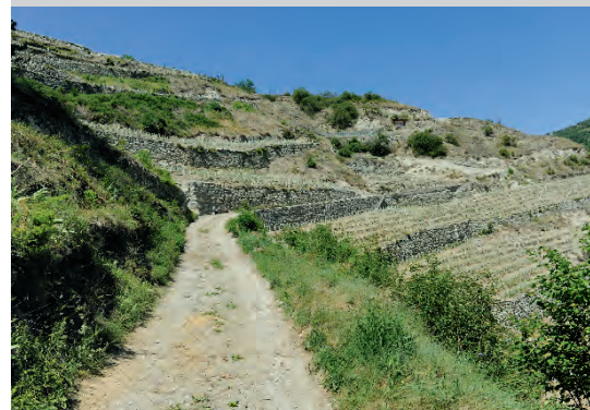
Le vignoble des Côtes au printemps