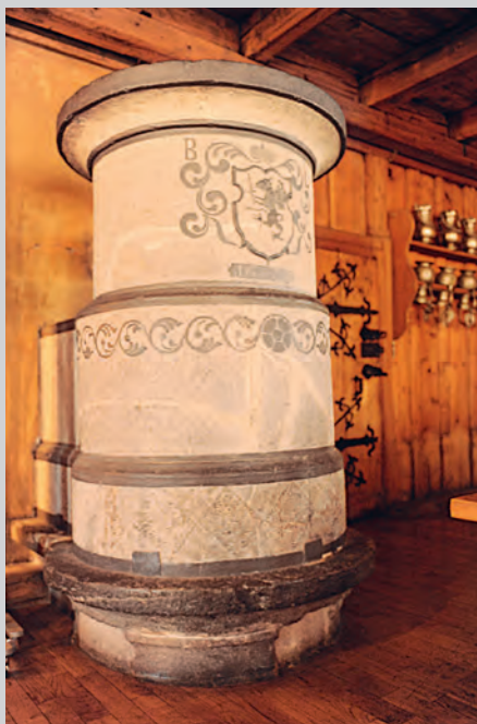
Pierre ollaire du Château de Loèche