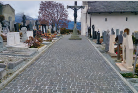
L'allée principale du cimetière

La municipalité de Vex les remercie chaleureusement pour leur dévouement et les félicite pour la distinction qu'ils ont obtenue.