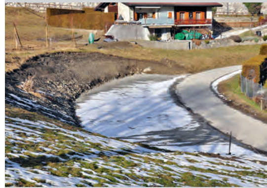
Le nouveau parking de la Combetta

Il est précisé que le parking de la Combetta n'est pas ouvert au public et que le stationnement n'y sera autorisé qu'aux véhicules pourvus d'une vignette (location).