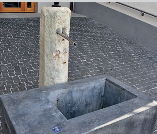
La fontaine à poussoir de la Maison Gauthier

pavés bruts de basalte gris. Félicitations à l'équipe des travaux publics qui a œuvré avec finesse sous le bientôt millénaire clocher de notre ancienne église.