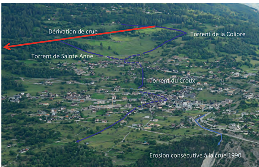
Les traits pleins représentent les torrents à ciel ouvert, alors que les traitillés signalent les tronçons enterrés. La flèche rouge localise le projet de déversoir de crue. La flèche bleu clair, l'écoulement lors de la crue 1990.

devrait rester en l'état, mais suite à la récente entrée en vigueur de la nouvelle loi il faudra compléter le dossier avec la définition de l'ERE (Espace réservé aux eaux – cf. encadrés ci-contre).